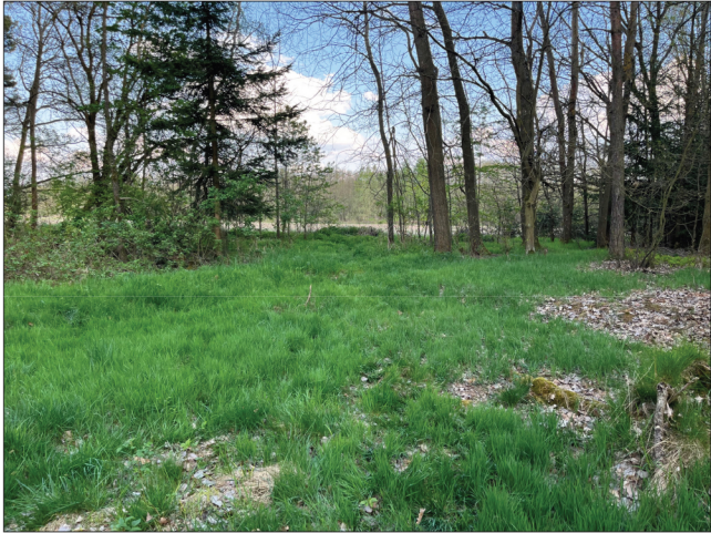
16. Při opuštění žirovického pohřebiště jihovýchodním vstupem, se otevře pohled na ornou půdu, která odděluje řešené území od Mlýnského rybníku (viz stáv stav 1 : 1800).