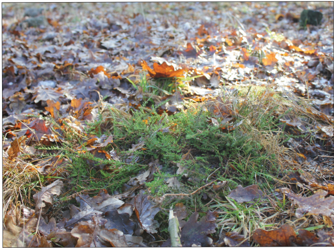
15. Na severu řešeného území, převážně na kamenitém podloží, se daří vřesu (Calluna vulgaris) viz výkres Stávající stav. Je to rostlina typická pro propustné písčité kyselé půdy.