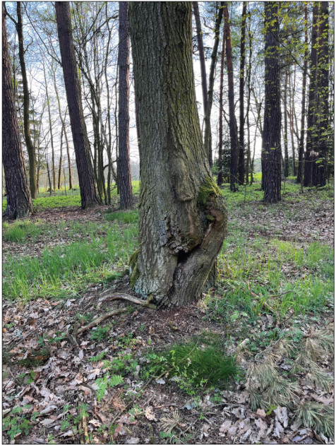
18. V jihozápadním rohu pohřebiště se vyjímá solitérní dub (Quercus robur), který je při bázi kmene deformován, na jeho vitalitě mu to však neubírá.