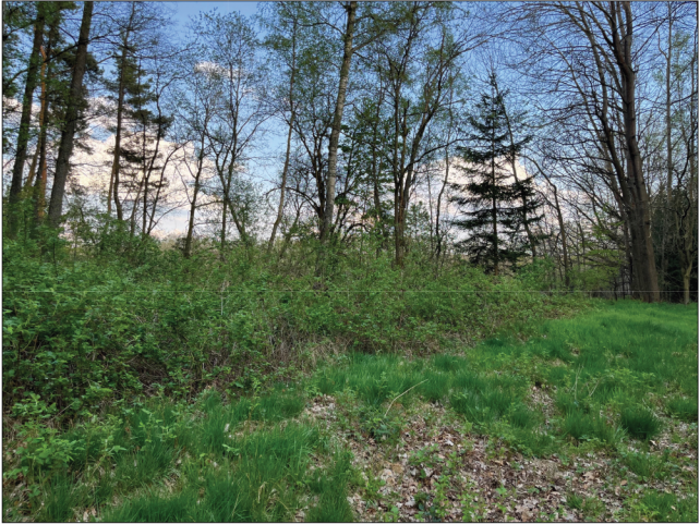
17. Více na východ tvoří přirozenou hranici mezi pohřebištem a okolním lesním porostem maliníkové houští, které je nutno udržovat řezem, aby nezarůstalo do plochy pohřebiště.