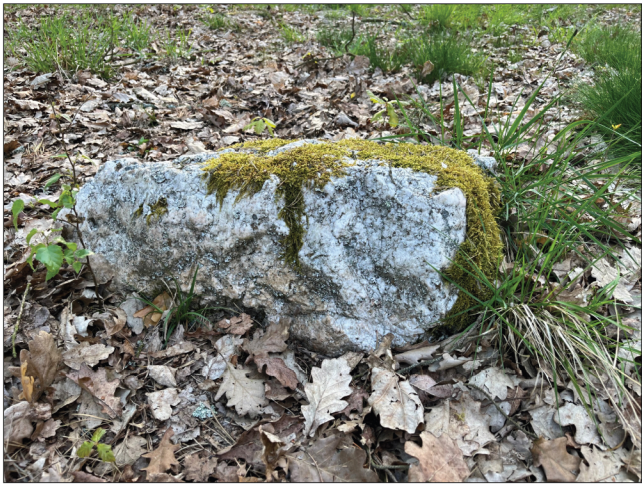
14. Většina hornin, které se na žirovickém pohřebišti nachází, jsou místním materiálem. Jedná se o značně zvětřelou, již ohlazenou Smrčinskou žulu.